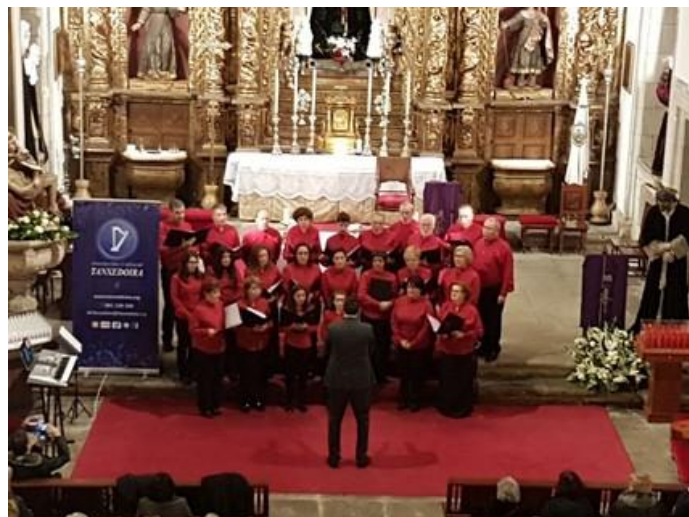
Actuación da nosa coral durante o concerto.