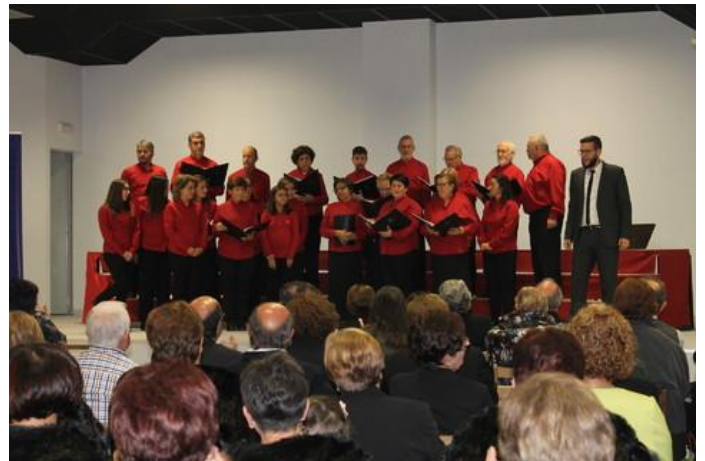
Na provincia de Pontevedra tamén souberon de nós.

de Corais que se celebrou en Atios o pasado 19 de novembro. Non podiamos deixar escapar esa invitación e aló marchamos no bus até o Auditorio da Casa Cultural de Atios, no Porriño. A verdade é que a acollida foi moi agarimosa e os membros da Asociación de Atios estiveron pendentes de nós en todo momento.