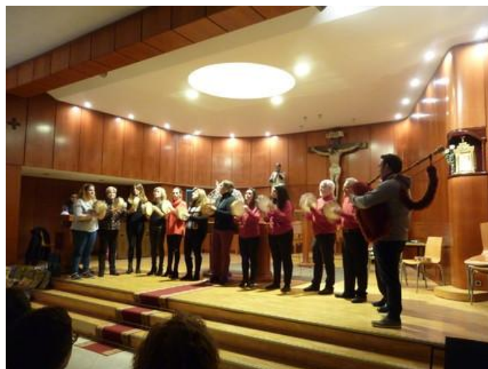
O noso grupo de pandeiretas en acción.