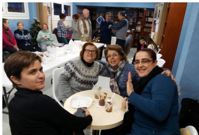
Chocolate houbo e larpeir@s non faltaron.

O pasado domingo 8 de xaneiro de 2018 fixemos unha chocolatada en Tanxedoira, veu moita xente e pasámolo xenial.