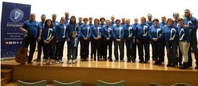
As voces que colaboran a darlle popularidade aos cantos.