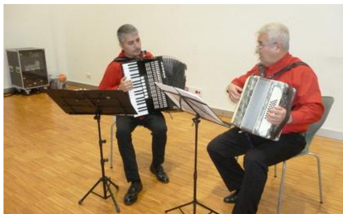
Actuación dos acordeonistas.