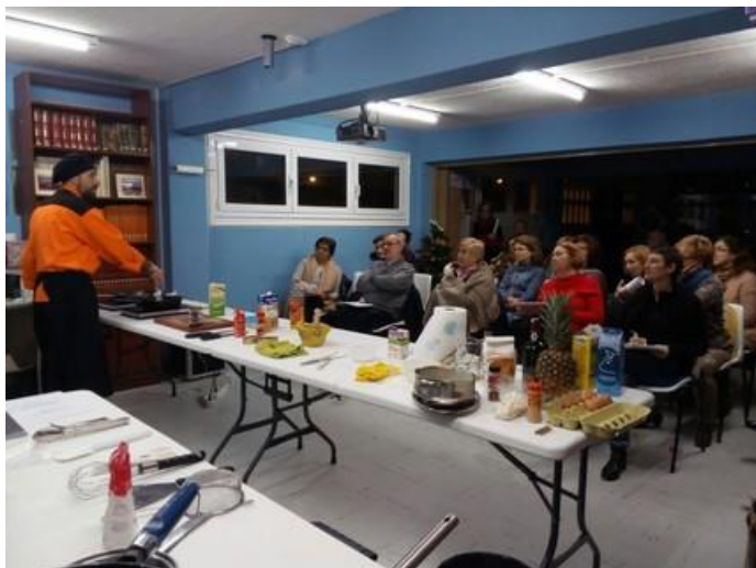
Os asistentes seguindo con interese as explicacións do chef.