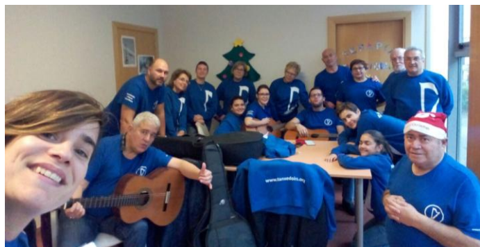
O Nadal notábase no ambiente.