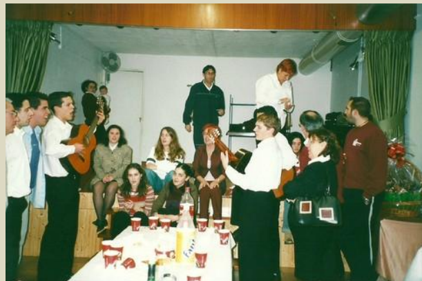
1989? Merenda do Festival de Rondallas, no local do lavadoiro de Monelos.